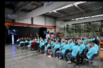
Convention MERCEDES-BENZ FRANCE Centre logistique