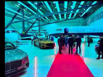
BENTLEY Paris au Bourget