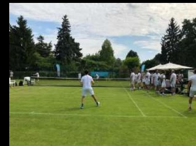
Tournois Tennis JAGUAR