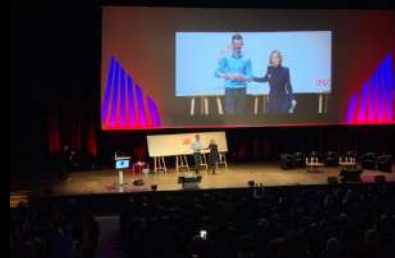
Convention INOVEA Palais Congrès de Bordeaux