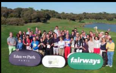
Fairways Golf Cup 4 saisons