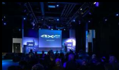
Convention JEEP Fleet & Business