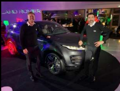
Roadshow LAND ROVER