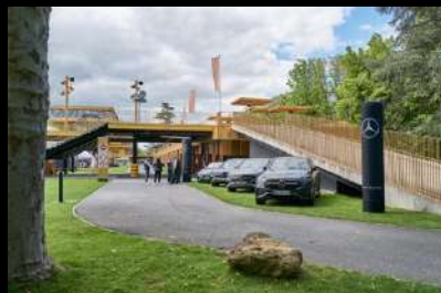
MERCEDES-BENZ PARIS, Hippodrome Longchamps