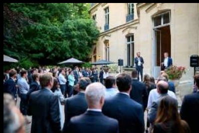
Soirée 15 ans E-CUBE