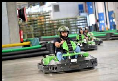
Family Days MERCEDES-BENZ FRANCE