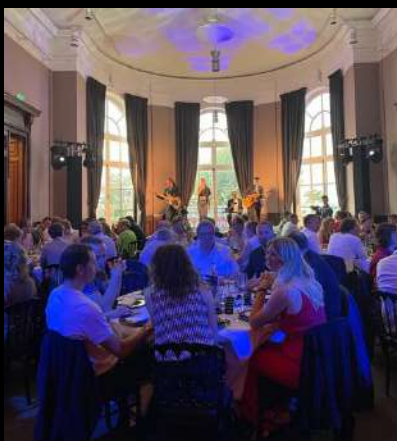
Séminaire LECLERC Deauville